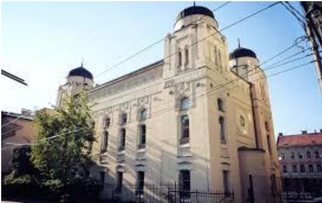
Синагога у Сарајеву, Босна и Херцеговина